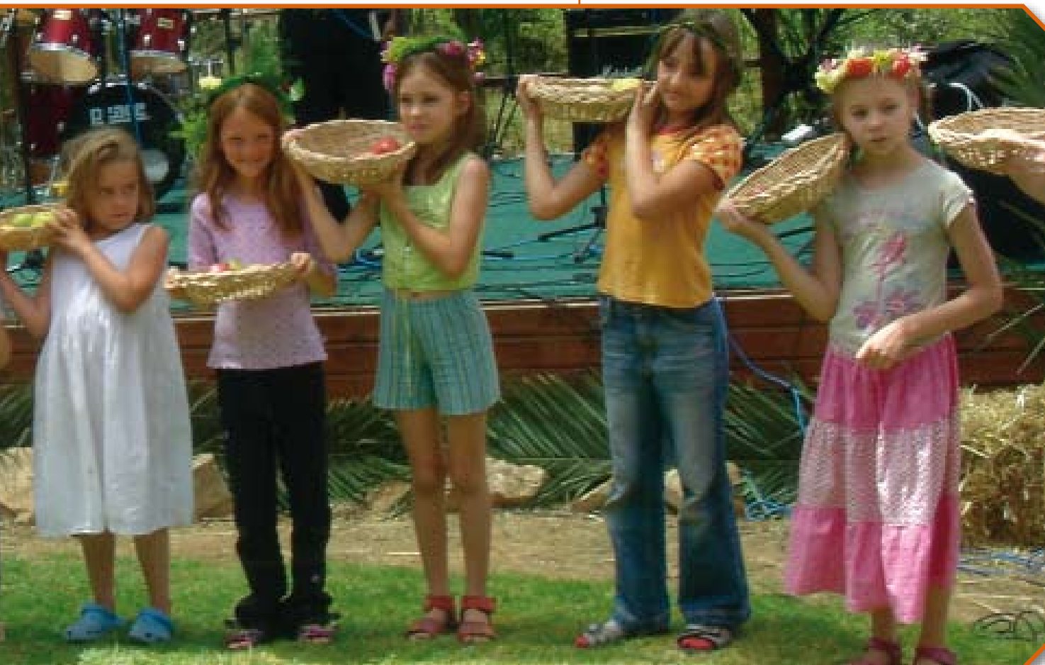
Шавуот 2006 года

Мы считаем для себя большой привилегией возможность служить Телу Мессии в Стране во всех этих сферах, которые Господь доверил нам. Уповая на Его милость и помощь, мы хотим оставаться верными и приносить много плода. Ω