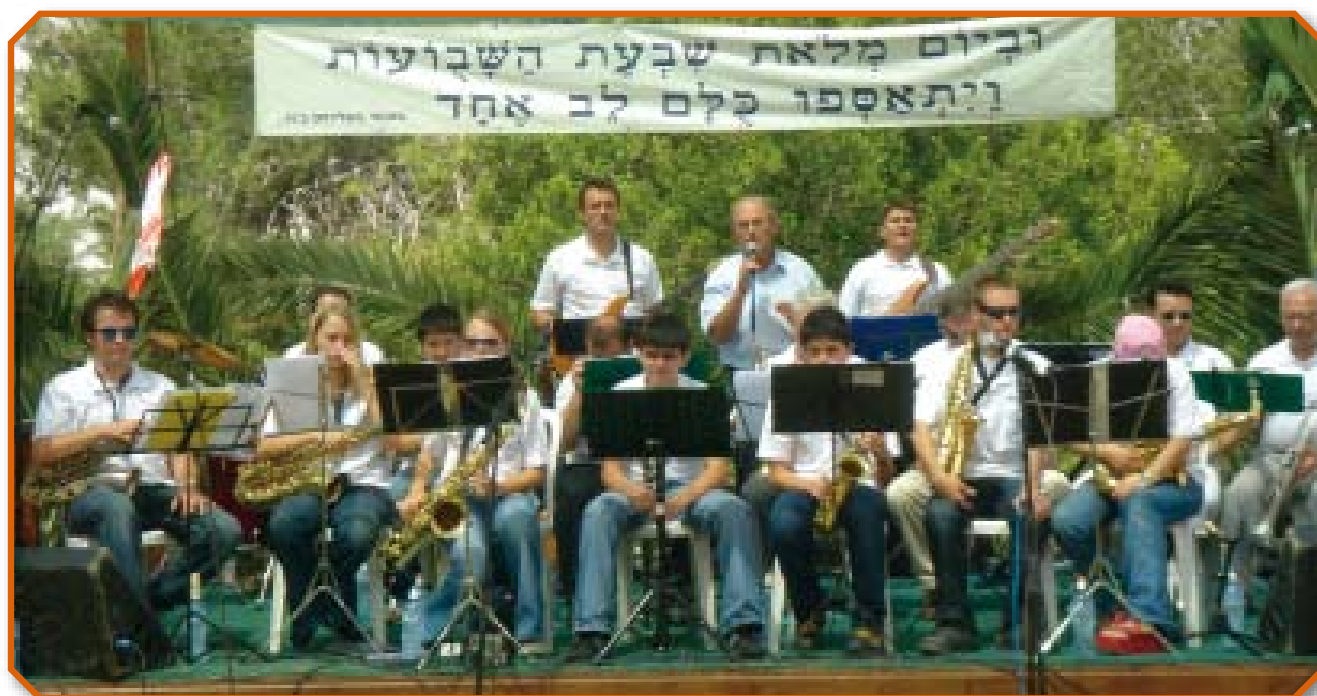
Праздник “Шавуот” в “Яд а-Шмона”, 2006-й год

В связи с этим мы радуемся, что за последние годы Господь расширил служение Альянса в Стране и очень благословил его.