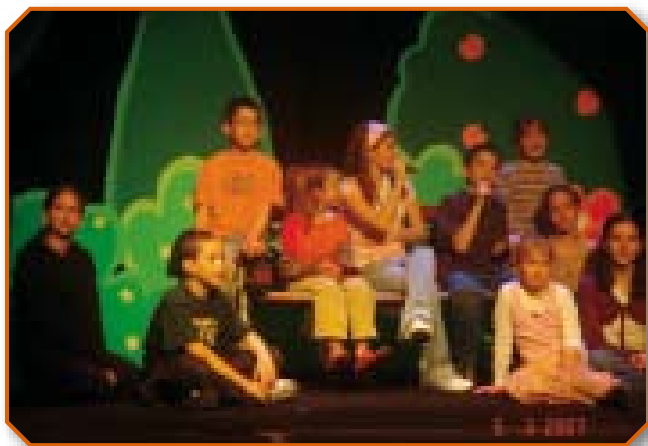
Детский фестиваль, март 2007-го года

Во время последнего праздника Пурим Альянс имел честь и благословение выдвинуть инициативу проведения детского мессианского фестиваля, а также организовать и финансировать его, - впервые за две тысячи лет. Было огромным благословением видеть сотни детей с родителями, приехавших в Иерусалим из общин со всех уголков Страны, на представление “Герои веры”. В дополнение к