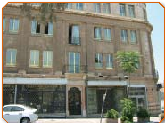
Место сбора на улице Царя Давида, 2007-й год

“Операция Милость” была водоразделом в современной истории мессианских евреев в Стране Израила. До нее большинство из них были подчинены церквям и миссионерским организациям из разных стран и находились под их влиянием, определявшим как их организационную