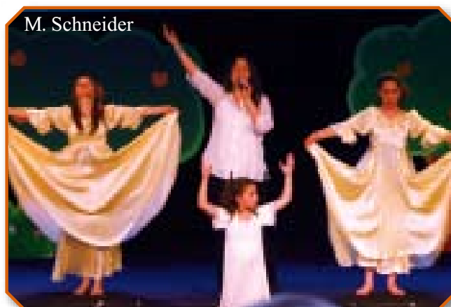
Детский фестиваль, март 2007-го года

Альянс также организует участие группы мессианских евреев в ежегодном марше, проводящемся в Иерусалиме во время праздника