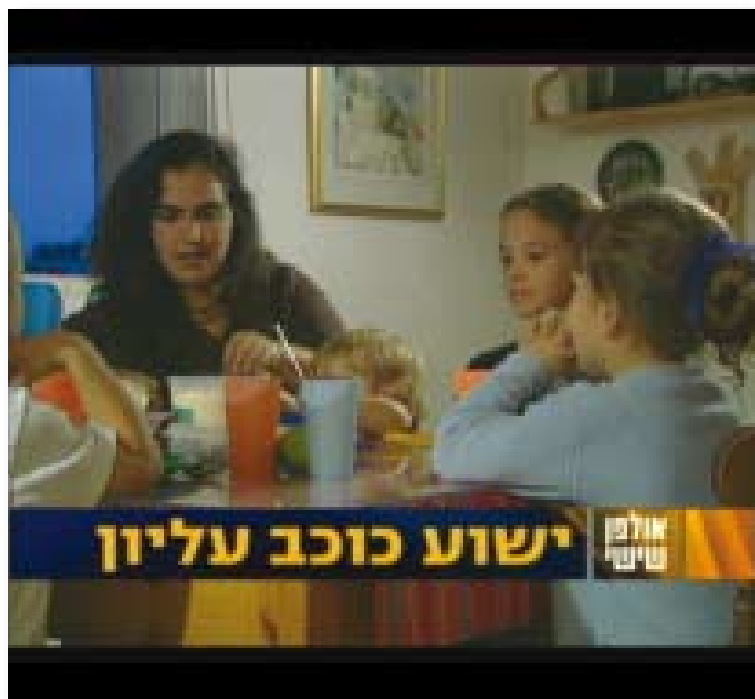
Семья Ронен в репортаже 2-го канала

К 10.4.07 было зарегистрировано 383 отзыва. Как и ожидалось, многие отреагировали на