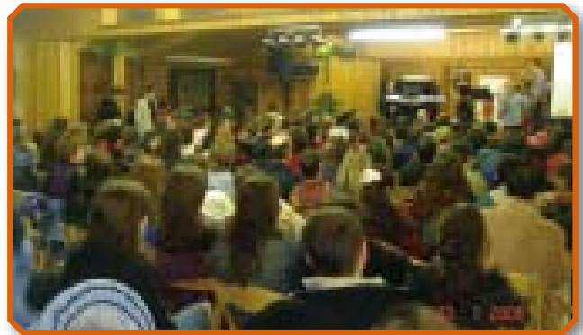
Музыкальная конференция в “Яд а-Шмона”

Группы прославления из более чем 20-ти общин, от Кармиэля на севере до Арада на юге, приехали с новыми песнями. Альянс, как обычно, издал музыкальную брошюру с нотами и текстами всех представленных на конференции песен на иврите и английском (транскрипция и перевод). Многие общины Страны приобрели эту брошюру и записи песен с конференции на четырех компакт-дисках. Верующие из этих общин выучили многие из этих песен и поют их во славу Бога.