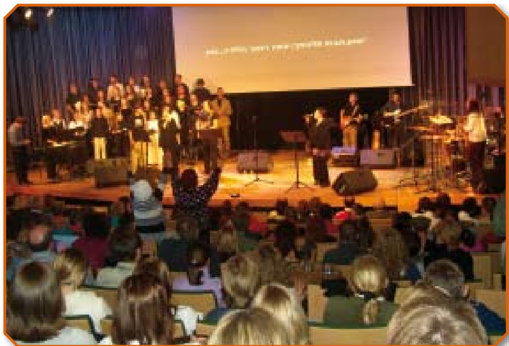
Концерт новых песен, декабрь 2004-го года

Альянс также организовал концерты новых песен, отобранных во время музыкальной конференции. Концерты прошли в иерусалимском зале “Павильон” и были большим благословением для всех присутствовавших. Записанный Альянсом компакт-диск “Тегила ле-Элоһэйну” (“Хвала Богу нашему”. – Прим. перев.) с песнями концерта, проведенного в конце 2004 года, стал одним из лучших дисков, когда-либо выпущенных Телом Мессии в Стране. Он разошелся в тысячах экземпляров по Стране и по всему миру. Мы надеемся в ближайшем будущем записать также компакт-диск и DVD с песнями, исполнявшимися на концерте 2006 года.