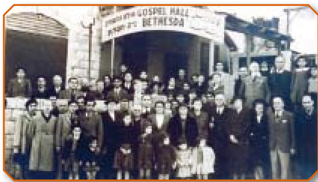
Община “Вифезда”, 1940-й год