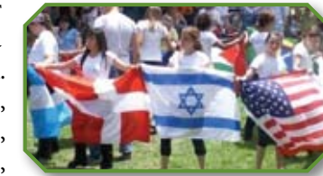
Конференция во время праздника «Шавуот» 2008 года

После того, как Апостолы Петр и Иоанн исцеляют хромого именем Мессии Иешуа, священники и саддукеи арестовывают их и сажают в тюрьму (стихи 1-2). (В современном Израиле такое пока еще не происходит, но именно этого добивается религиозный истеблишмент: провести законы против благовестования об имени Иешуа, чтобы стало возможно «законным» образом