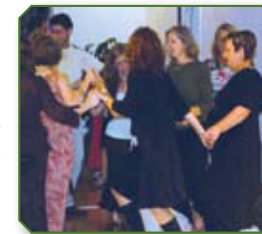
Танцы в общине

Во-вторых, как народ священников, мы призваны к молитве и ходатайству. Мы все призваны нести имена сынов Израилевых на своих плечах и сердцах, и приходить перед Ним с ходатайством, молитвой и мольбой за наш народ и за другие общины в Теле