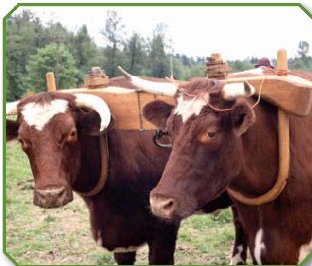
Праздник «Шавуот» в «Яд а-Шмона», 2006-й год

Апостол Павел сказал также в своем послании к Римлянам так: «Немощного в вере принимайте без споров о мнениях» (14:7) и «Посему принимайте друг друга, как и Христос принял вас в славу Божию» (Римл. 15:7). Если мы не сможем идти друг другу на уступки и компромиссы в тех вещах, которые не являются принципиальными, мы будем не в состоянии иметь здоровое общение. Подумайте о том, на какие лишения пошел Господь Иешуа для того, чтобы иметь общение с нами! Ω