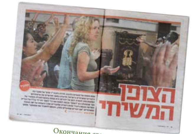
Окончание статьи со стр

В газете помещены фотографии многих верующих из общины «Тиферет Иешуа», среди них – фотографии и самой журналистки, на одной из которых она запечатлена участвующей в собрании общины, а на другой – раздающей брошюры на улице одного из городов Израиля. Закончив сбор материалов, которые