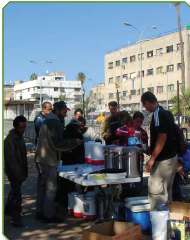
Евангелизация в Тель-Авиве

Каждый раз он пользовался одним и тем же методом: