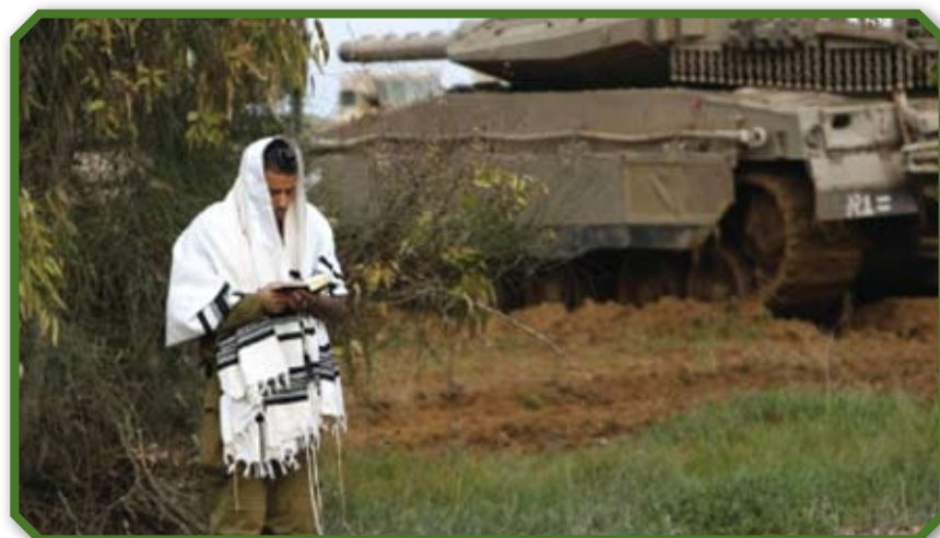
Солдат на границе сектора Газы

Мы молимся о том, чтобы с помощью нашего Отца Небесного и Господа Мессии Иешуа мы смогли понять смысл военных и политических событий, происходящих вокруг нас в эти дни, относящиеся к последнему времени. Возвращение Господа близко, и нам брошен вызов бодрствовать и продолжать усердный труд в канун Его пришествия, «ибо в который час не думаете, придет Сын Человеческий» (Матф. 24:44). Ω