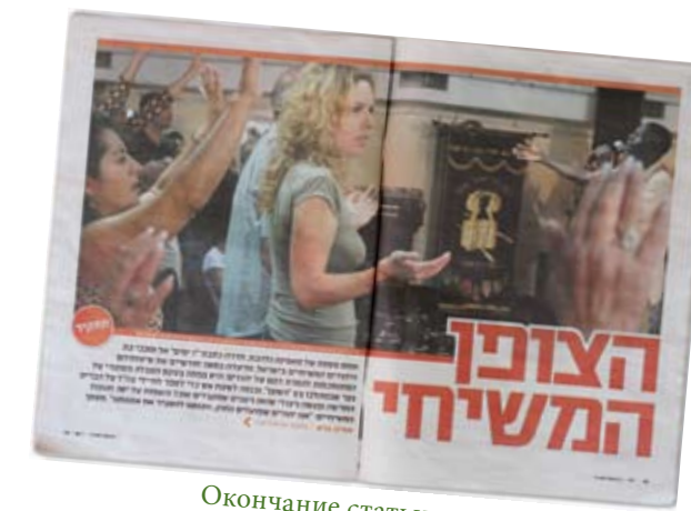
Окончание статьи со стр

В газете помещены фотографии многих верующих из общины «Тиферет Иешуа», среди них – фотографии и самой журналистки, на одной из которых она запечатлена участвующей в собрании общины, а на другой – раздающей брошюры на улице одного из городов Израиля. Закончив сбор материалов, которые