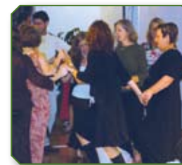
Танцы в общине

Во-вторых, как народ священников, мы призваны к молитве и ходатайству. Мы все призваны нести имена сынов Израилевых на своих плечах и сердцах, и приходить перед Ним с ходатайством, молитвой и мольбой за наш народ и за другие общины в Теле